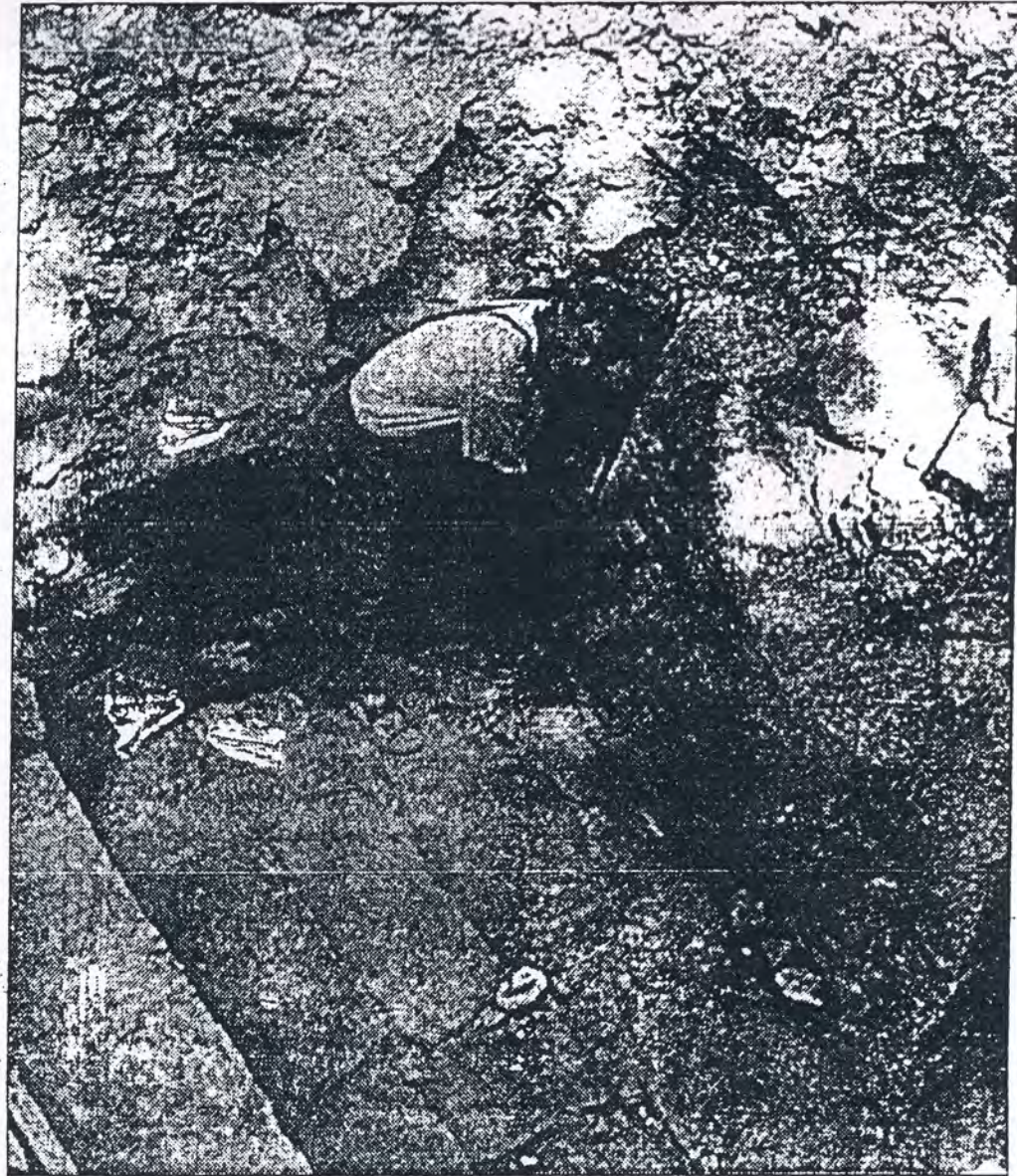
الخبير الانكليزي في الموقع