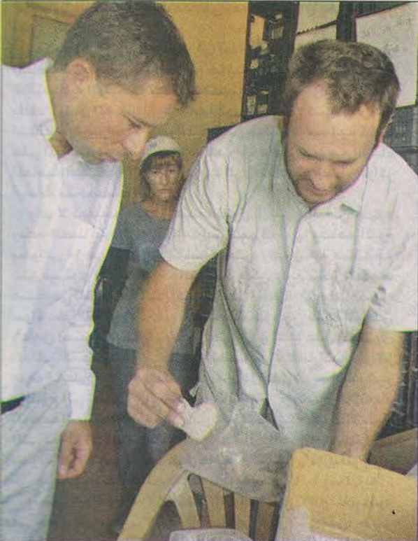
السفير البريطاني يتفحص احدي القطع الأثرية

الاكتشافات الجديدة في صيدا، هي هامة جداً، لأنها تتم في حفريات للآثار يتم التنقيب والبحث عنها في وسط مدينة لها تاريخها وحضارتها. وما تقوم